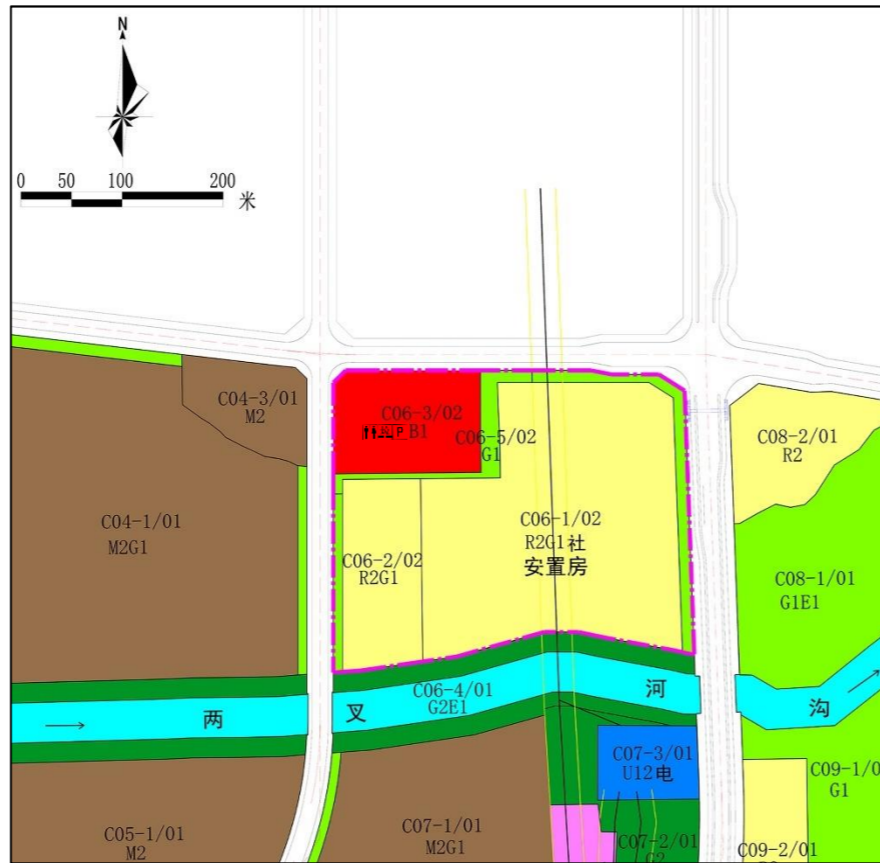
修改后土地利用规划图