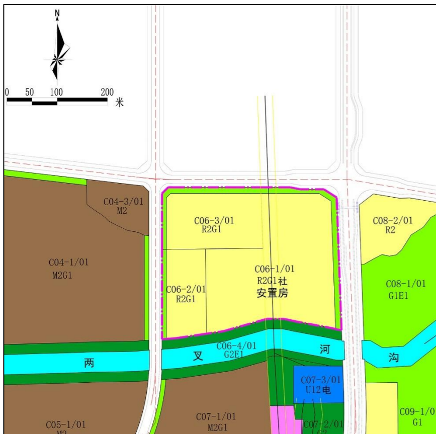
修改前土地利用规划图