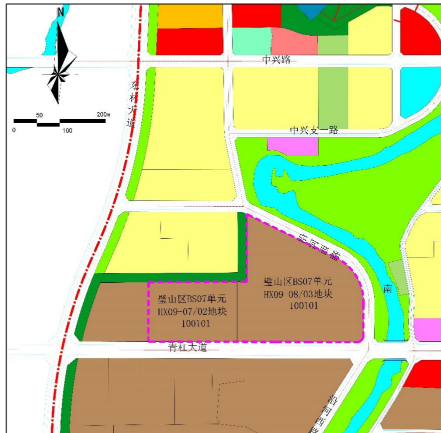
修改后土地利用规划图