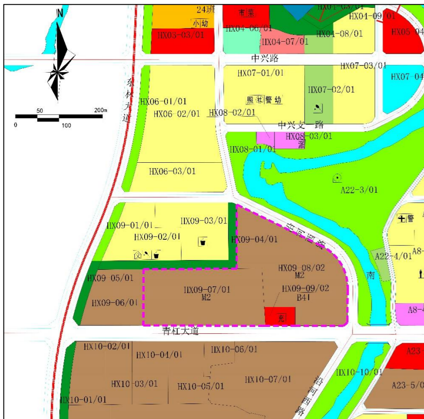
修改前土地利用规划图